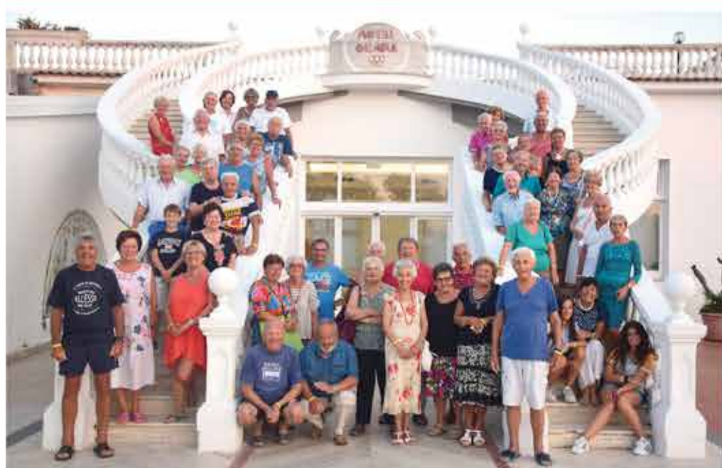
In alto: il bel gruppo di Spille d'Oro sulla scalinata di Superga nel corso della gita dell'agosto scorso. Sotto: coreografica foto di gruppo dei partecipanti al soggiorno in Cilento all'Olimpia Resort.