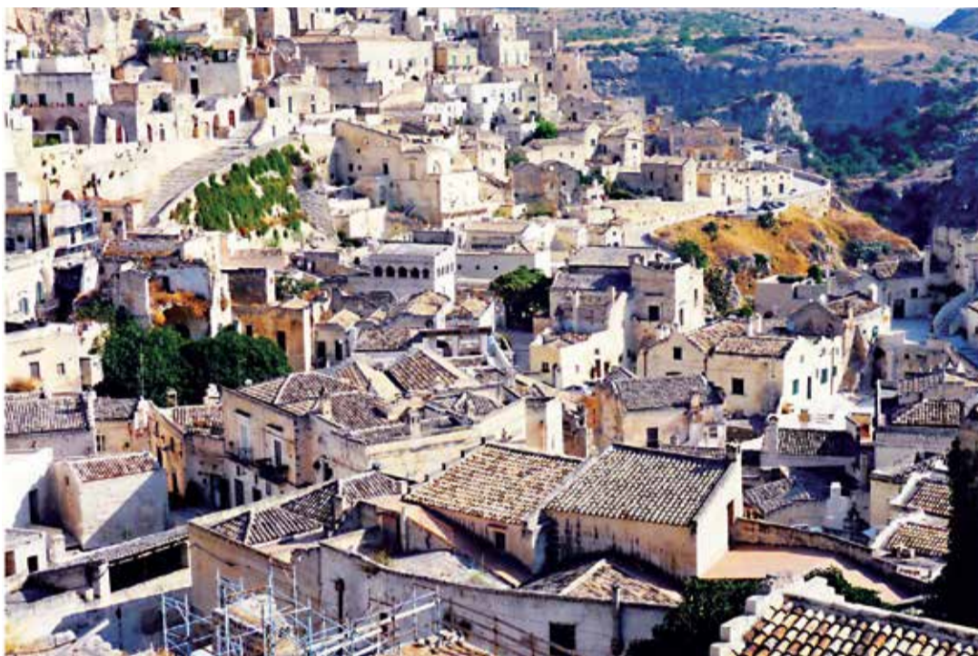
In questa pagina: due belle vedute dei Sassi di Matera.